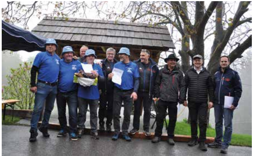
Das Siegerteam Tieber

Am 13. Mai fand das 11. Straßenturnier der 11-er Runde statt. 16 Mannschaften nahmen daran teil.